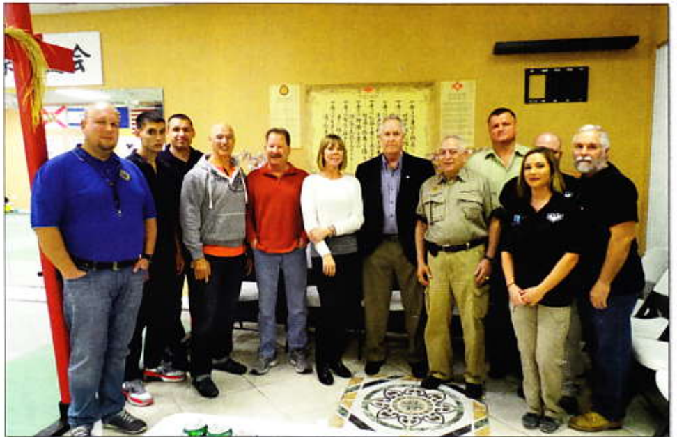
Január végén Sarasotában ülésezett a az V. Partnership for Security rendezvény előkészítő bizottsága

rús tankig sok minden található ott –, és ezen térképek alapján meghatározzák a bűvároknak, hogy melyik roncsot derítsék fel és kutassák. Az oktatók víz alatti felvételeket, fotókat és videókat készítenek és a későbbiekben a bűvárokkal együtt elemzik azokat. Minden olyan aktivitásról, amelyben vizsgát tesznek, képzettséget szereznek, a nemzetközi bűvárszervezet diplomát bocsát ki a résztvevőknek. A bűvárkodás programjaiban szerepel a víz alatti vadászat halakra, rákokra, és cápákkal való találkozás is.