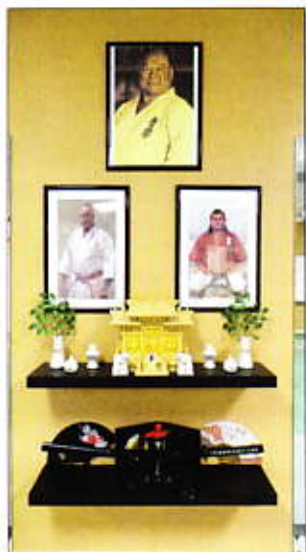
Legendás harcosok dicsőséfgala

Folytatjuk a hagyományos nyílt szakmai konferenciák szervezését a balkáni országokban. Terveink szerint 2016 nyarán Montenegró lesz a következő Balkán régiós tanácskozás helyszíne. Az IBSSA