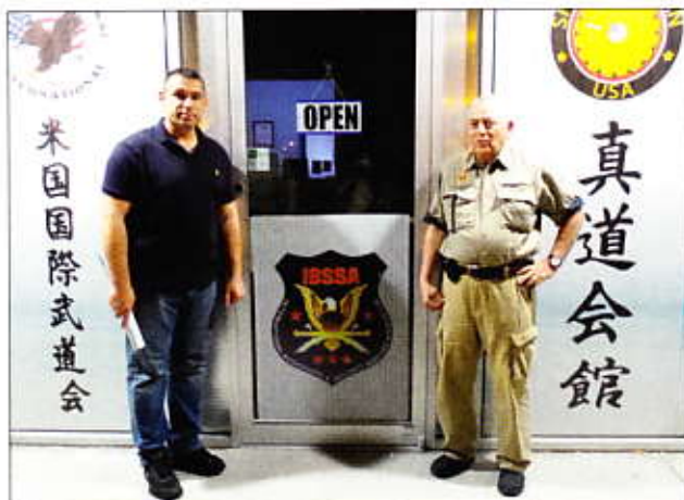
Floridában két új kiképzőbázis nyílt, az egyik Sarasotában