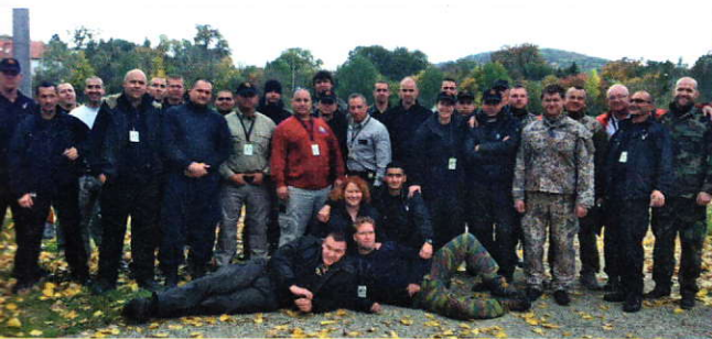
XI. SEC-tember – csoportkép