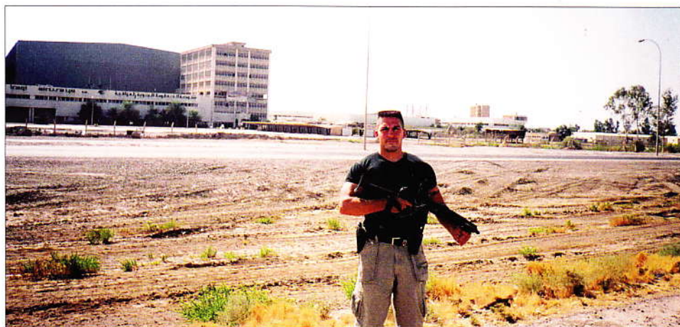
Irakban 2004-ben hat hónapot dolgozott, minden nap életveszélyben volt. Feladatát mégis elvégezte

a lehető legmostohább körülmények között voltunk, ahol szinte a földbe tapossák a civil lényedet, fizikailag, szellemileg, morálisan. Kiirtva az önálló döntési képességet egy olyan katonává formálnak át, aki feltétel nélkül engedelmeskedik bármilyen parancsnak. Azt is megtanították, hogy indulat és gyűlölet nélkül harcoljunk, és tiszteljük a legyőzött ellenséget. Ezután kötöttük meg az öt évre szóló szerződést.