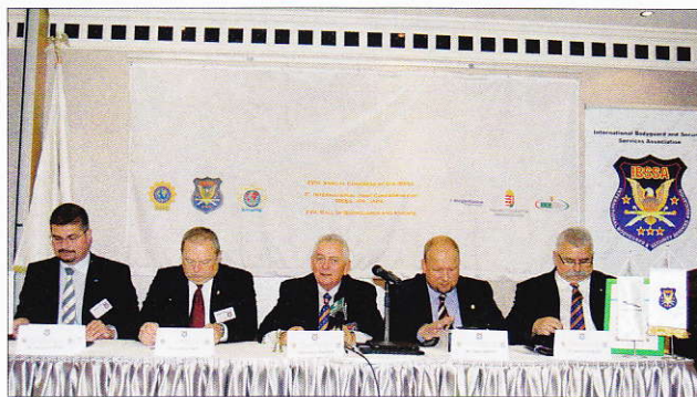
Az elnökséget újraválasztották a konferencián