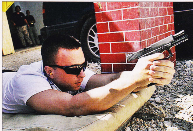
Negyvennyolc hazai és külföldi lövész versengett egymással

A csapatverseny győztese az Ötfegyver Kupa Team, má-