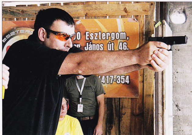
A nemzetközi szituációs lőversenyt idén Esztergomban rendezték meg